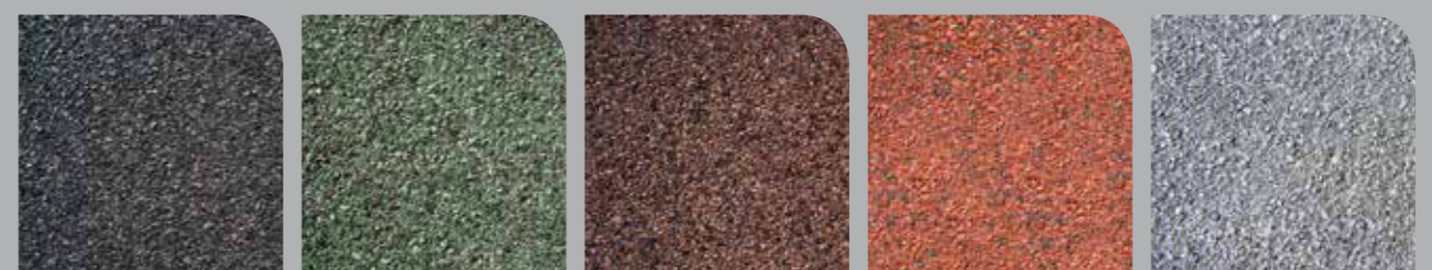
02 | Μαύρο